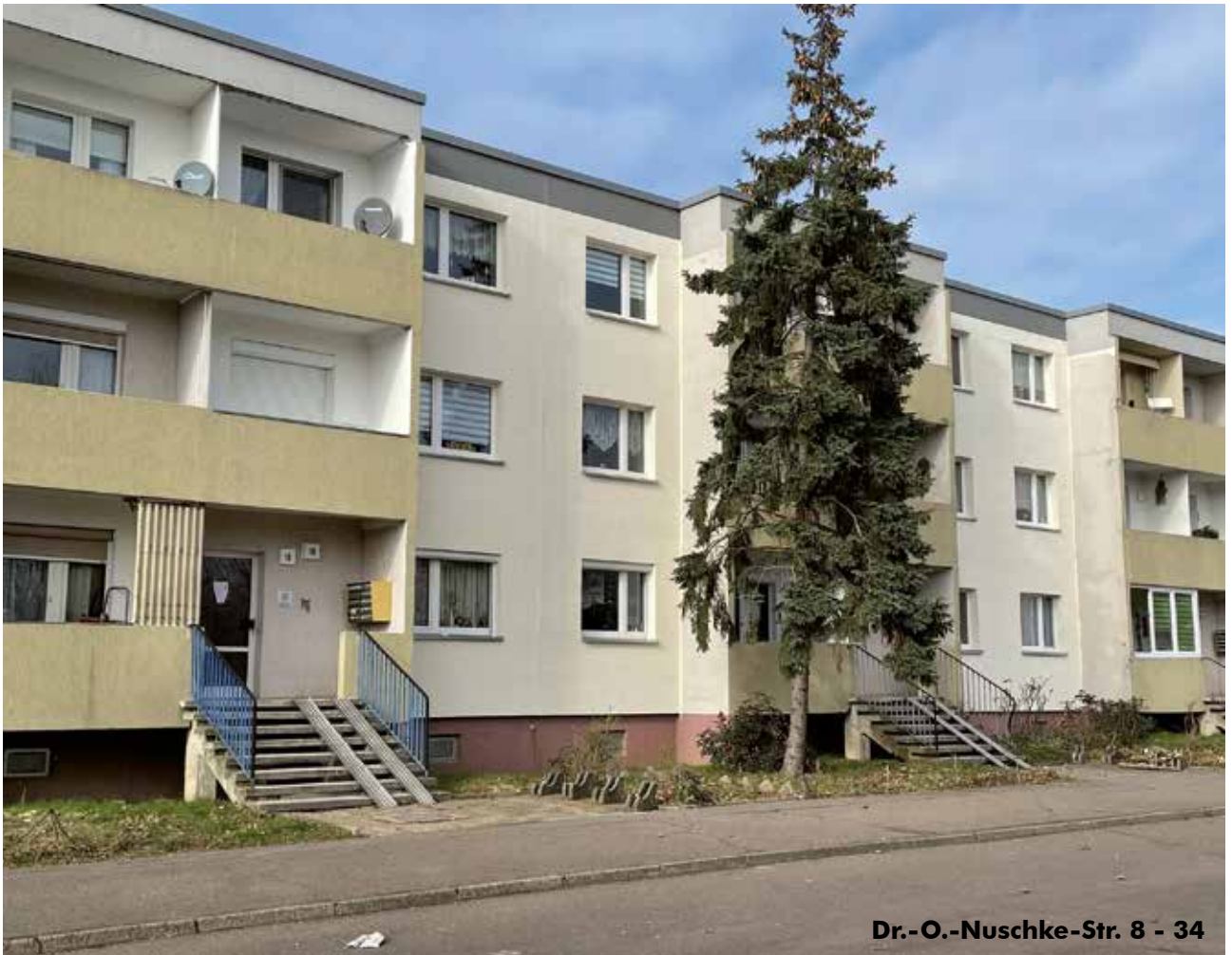
Dr.-O.-Nuschke-Str. 8 - 34

140 Wohnungen lediglich 64 Wohnungen übrig bleiben .