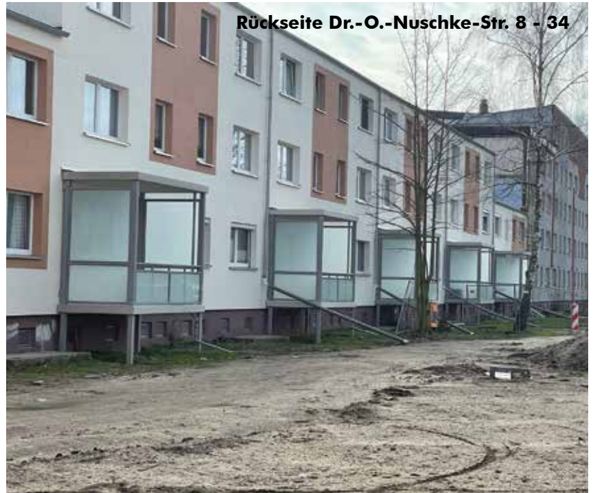
Rückseite Dr.-O.-Nuschke-Str. 8 - 34

den Teilrückbau sowie die Fertigstellung des Wohngebäudes Dr.-O.-Nuschke-Str. 8 - 34, wo von