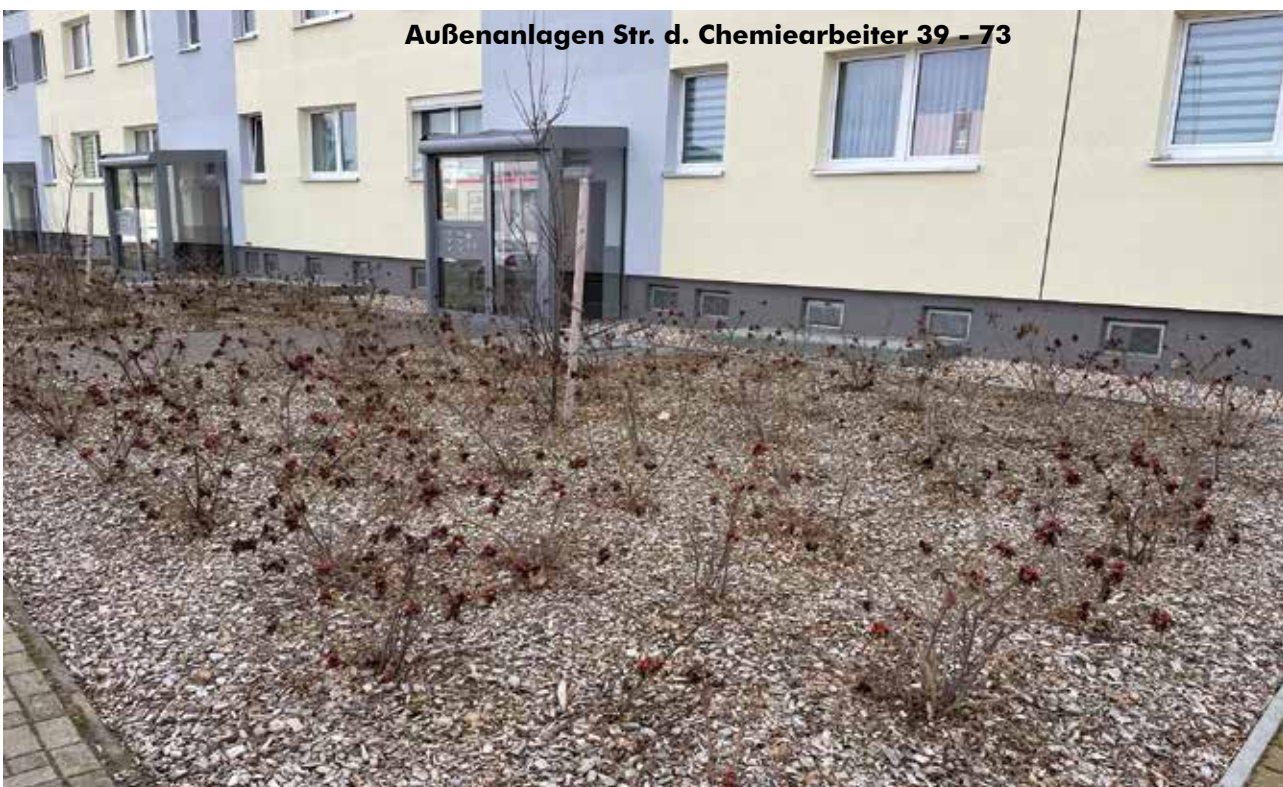
Außenanlagen Str. d. Chemiarbeiter 39 - 73

Auf das Erreichte hier am Standort können wir alle stolz sein, wenn auch diese vollständigen Sanierungs- und Modernisierungsmaßnahmen zu Unmut in der Mieterschaft geführt haben. Bitte haben Sie weiterhin Verständnis.