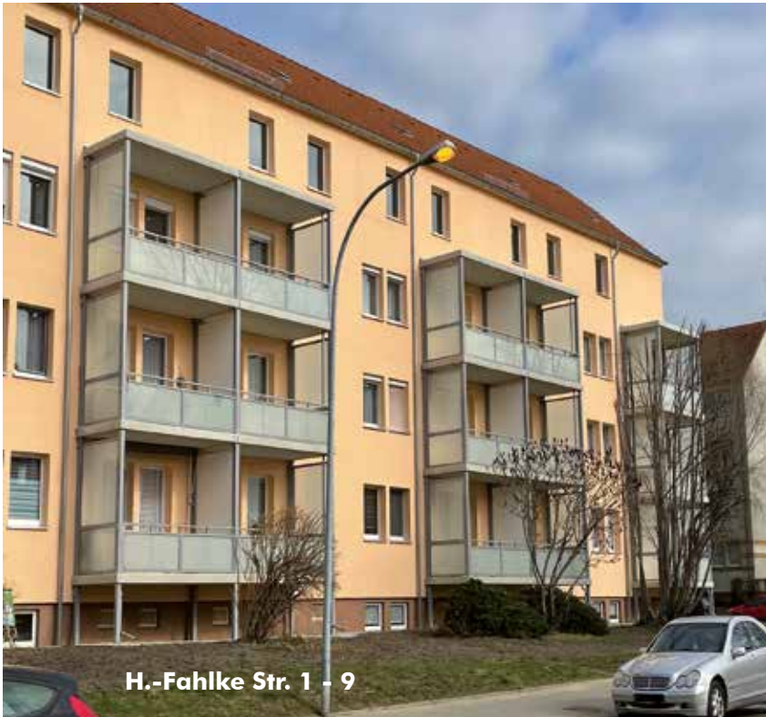
H.-Fahlke Str. 1 - 9

Die Maßnahmen in der H.-Fahlke-Str. 1 - 7 sollen fertig gestellt werden. Geplant war ebenfalls die M.-Lademann-Str. 1 - 7, ob wir die Umsetzung in diesem Jahr schaffen, bleibt noch offen.