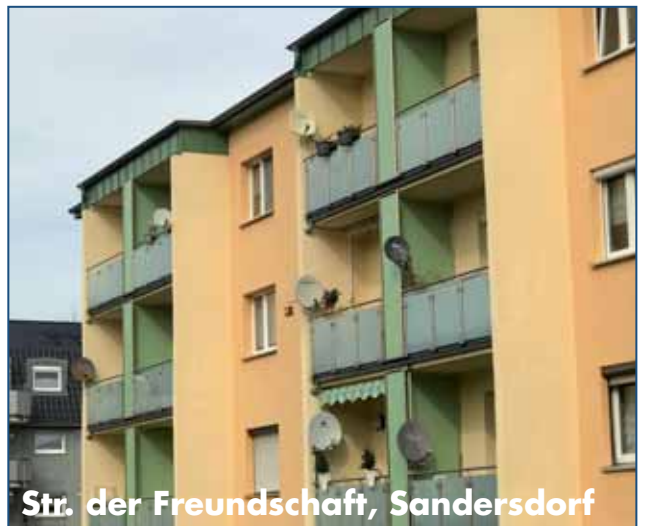
Str. der Freundschaft, Sandersdorf

Auf unseren Wohngebäuden Str. der Neuen Zeit 13 – 18, Str. der Freundschaft 2 – 6 in Sandersdorf werden wir Satellitenempfangsanlagen installieren. Damit gehört dann der unansehnliche Schüsselwald auf vielen Balkonen hoffentlich bald der Vergangenheit an. Die betroffenen Wohnanlagen wurden per Aushang informiert. Für die Nutzung der gemeinschaftlichen Anlage wird dann eine Anpassung der monatlichen Betriebskostenvorauszahlung von bis zu 4,00 Euro erfolgen.