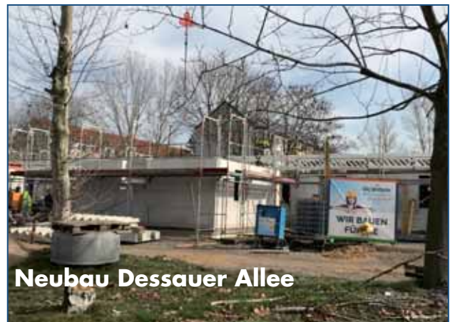
Neubau Dessauer Allee

nungen in der Dessauer Allee im Akademikerviertel von Wolfen wurde begonnen. Der strenge Wintereinbruch hat leider zu Verzögerungen geführt, so dass mit der Fertigstellung erst im Jahr 2022 zu rechnen ist.