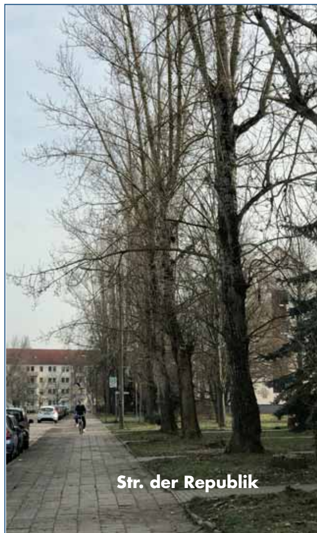
Str. der Republik

Die Schätzung der Gesamtkosten für die o.a. Wohnumfeldmaßnahme belaufen sich auf ca. 80.000,00 € brutto.