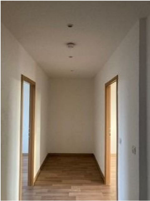
Bad 2 Bitterfelder Straße.jpg