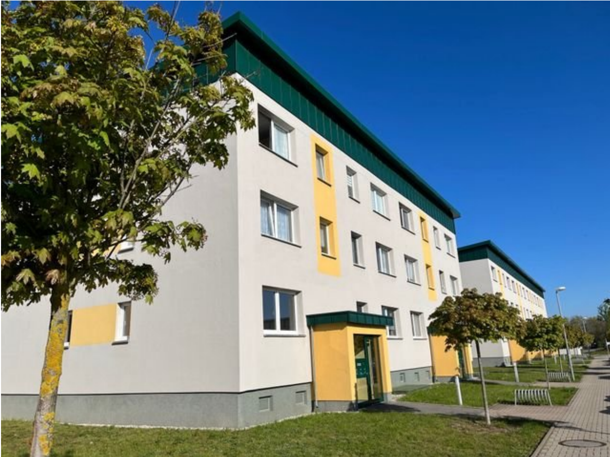
Straße der Aktivisten 2-8 Front 2.jpg